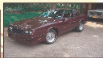
Chevrolet Monte Carlo SS 1987. 350, VR. Aut. In goede staat. 9.950,- Euro

Postadres: Tjoelker Snackservice Mieden 8 9866 TM Lutjegast