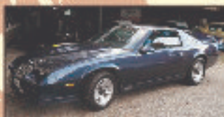
Chevrolet Camaro Z28 Targa 1984. VR. Aut. APK. In zeer goede staat. 6.950,- Euro